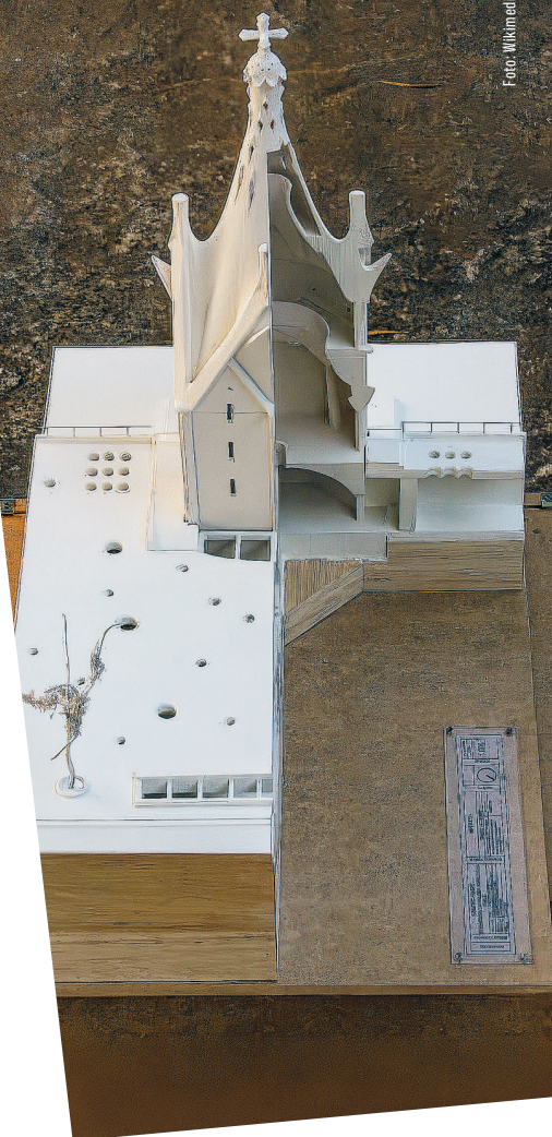
Modell der Kapelle «Nuestra Señora de los Ángeles» in Rancagua, Chile.